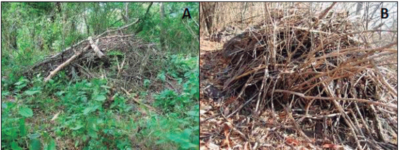
Figura 3. Madrigueras de H. alleni construidas en el suelo con una gran acumulación de ramas y otros materiales orgánicos. A) en temporada de lluvias, B) en temporada de secas.