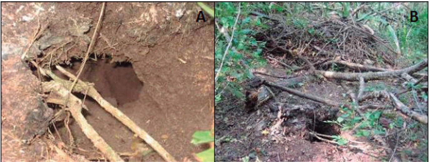
Figura 2. Madrigueras de Hodomys alleni construidas en el suelo. A) La madriguera consistió de un hoyo con un túnel. B) Madriguera consistente en un hoyo, acumulación de ramas y otros materiales orgánicos; similar a las de las ratas del género Neotoma .