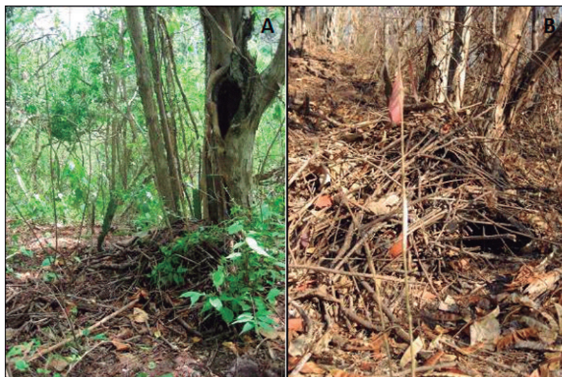
Figura 4. Madrigueras de H. alleni construidas en la base de un árbol. A) en temporada de lluvias, B) en temporada de secas.